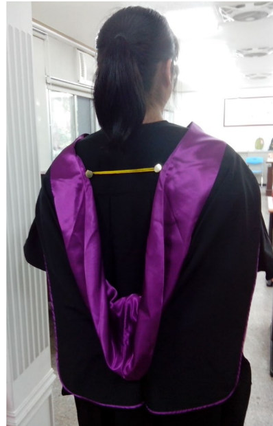
披肩穿戴方式(背面樣式)